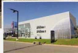
Pabellón NA-SA Estudio Asociado: Aprile y Asoc.