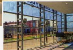
Pabellón Agua: Energía y Desarrollo