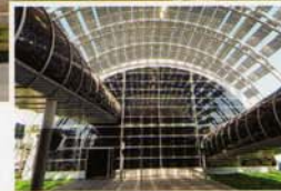
Pabellón Telecomunicaciones La máquina del tiempo